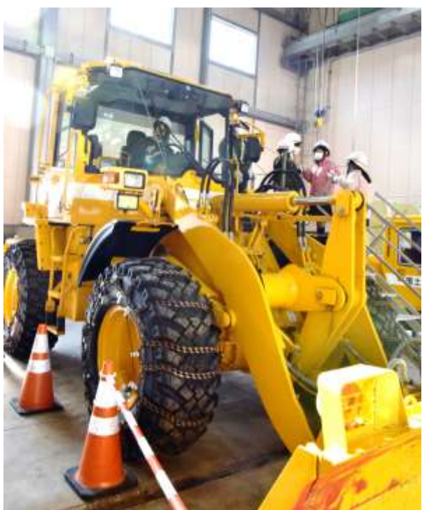
大きな除雪機械の見学