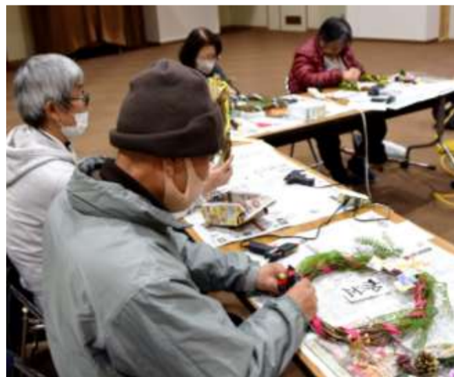
「賀正」を中央にして飾り付けされる参加者