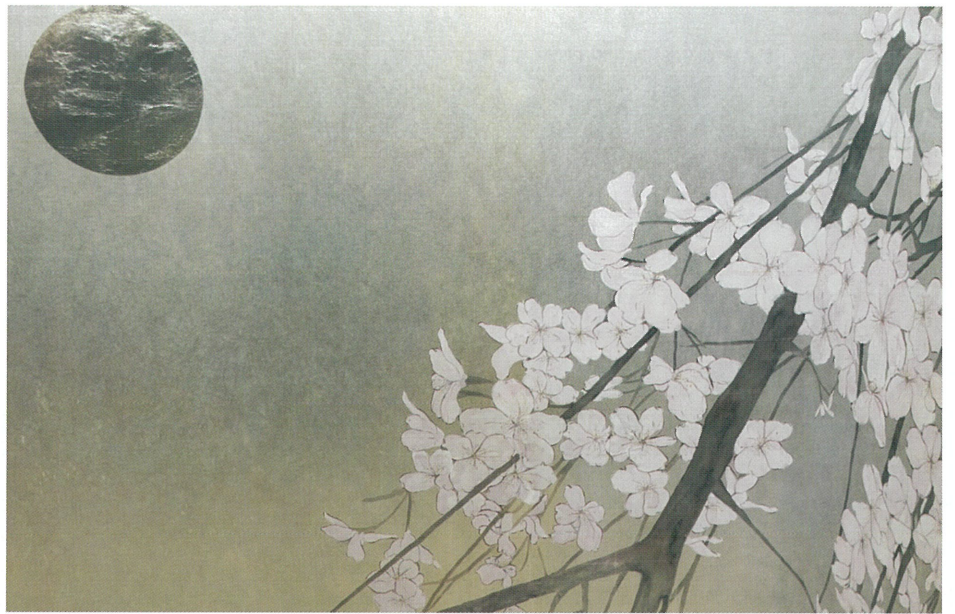
「枝垂桜」2026年 銀屏風 アクリル