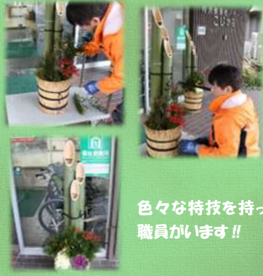
色々な特技を持った職員がいます!!

お正月に向けて職員による門松作りを行っています。材料の調達から飾りつけまで、すべて手作りで。皆さまに良い一年を送っていただけるよう、心を込めて作りました。