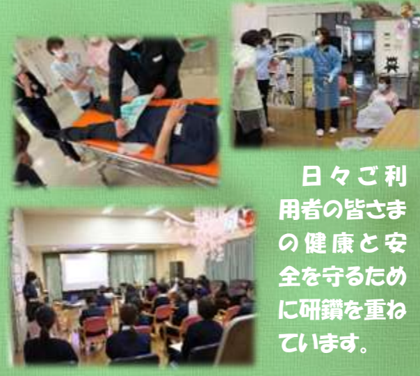
日々ご利用者の皆さまの健康と安全を守るために研鑽を重ねています。

令和7年度も様々な研修を実施しました。職員が講師となって行う感染症対応研修や介護技術研修、外部講師を招いて救命講習や窒息時の対応法などの研修を行いました。