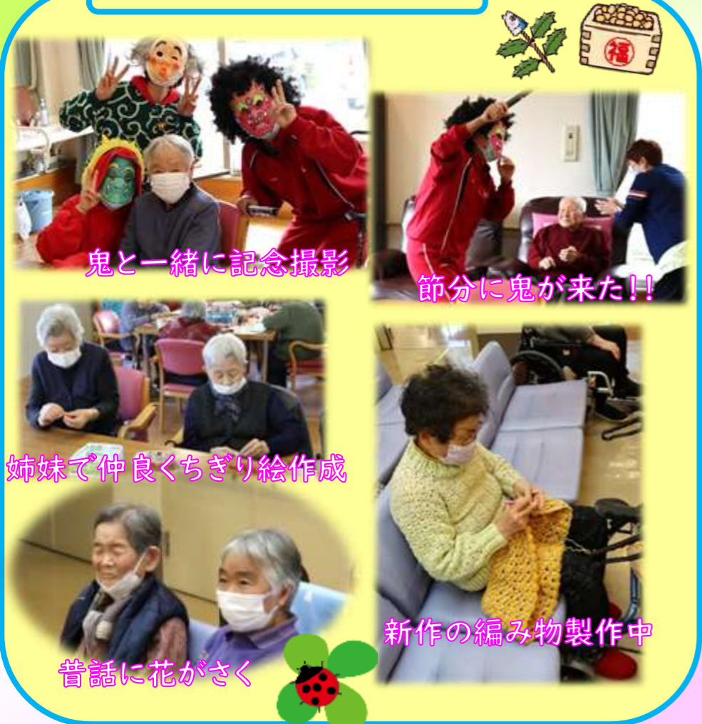
鬼と一緒に記念撮影