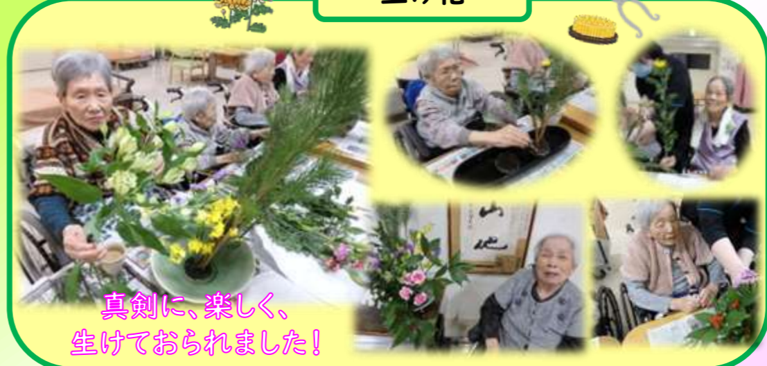
真剣に、楽しく、 生けておられました!