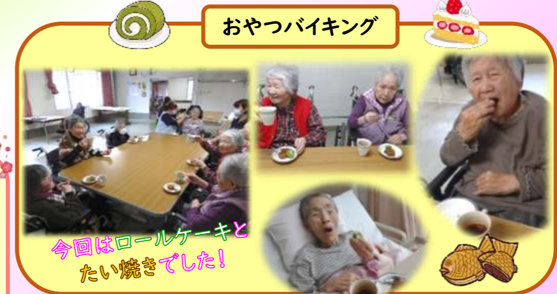
今回はロールケーキと たい焼きでした!