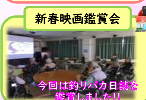
今回は釣りバカ日誌を 鑑賞しました!!