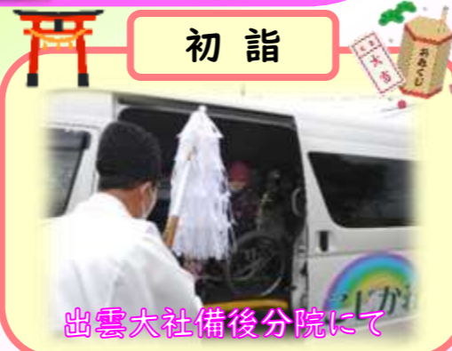
出雲大社備後分院にて