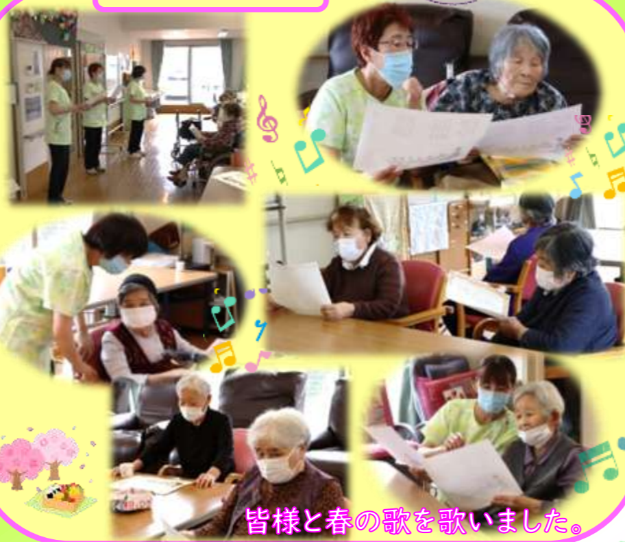
皆様と春の歌を歌いました。