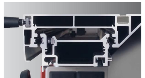
スムーズなスライドテーブル