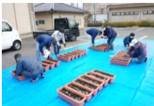
部会員による球根の植付け作業