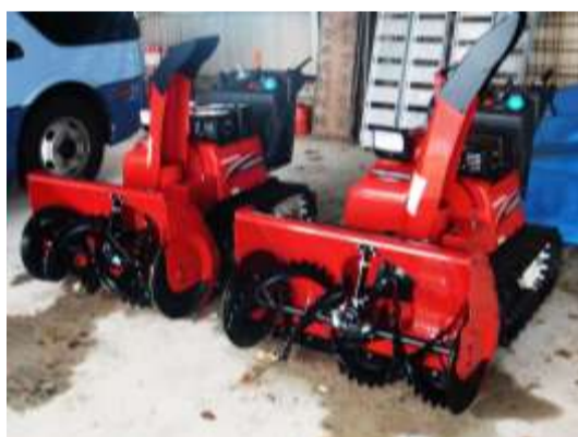
整備された2台の除雪機

布野町では冬の除雪が大きな課題です。高齢や障害などでどうしても自力で除雪が困難な方もおられます。布野町まちづくり連合会では、住民相互の助け合いとして『地域除雪活動支援制度』を令和2年度に制定しました。