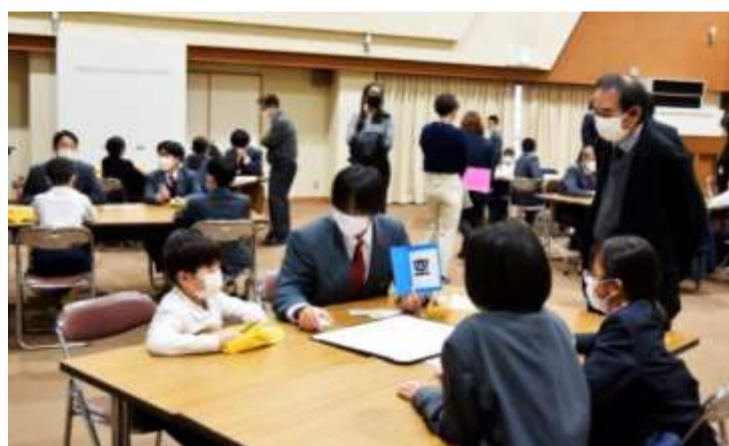
班別に短歌を考える児童生徒たち

小中学生が一緒になったグループごとにテーマを決め、短歌を創作しました。そして作品の発表と感想を交換したり好きな歌に投票したりと、歌に親しむ時間を過ごしていました。