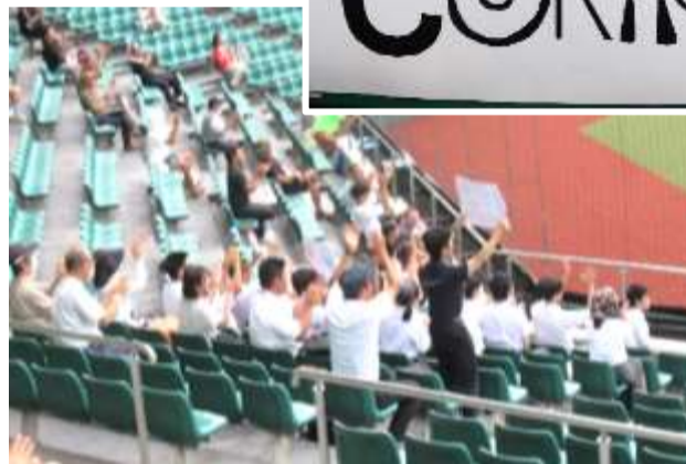
プラカードを使って元気に応援

事前にフランスの言葉や文化を調べ、協力して応援プラカードや国旗を作成しました。球場ではプラカードを使って情熱的(!)な応援をしました。すると試合後、フランス選手が観覧席に駆け寄り「アリガトウ」と言ってくださいました。スポーツを通して、国を越えたつながりを実感することができました。