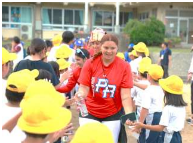
陽気なプエルトリコ選手と交流

子どもたちは「話したり野球を教えてもらった。」「野球のカッコよさが分かった」などととても喜んでいました。他国の方々と関わる貴重で充実した機会になりました。