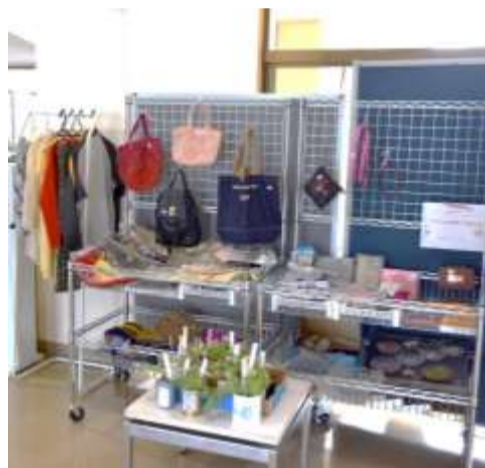
良心事方式？のワゴン。お金を入れてね

布野生涯学習センターでは、毎月1回センターカフェにあわせてフリーマーケットを実施しています。このたび、ロビーに「まちづくり市」としてワゴン常設、いつでも購入できるようにしましたのでご利用ください。また家庭にある不要なものを、価格応談で買取りを行っています。“もったいない精神”でリユース・リサイクルに皆様のご協力をお願いします。