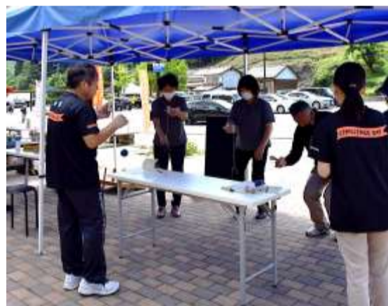
道の駅での チャレンジコーナー

日常的な運動やスポーツ習慣の定着を目的に開催される「チャレンジデー」は、町内外の交流にも役立っています。