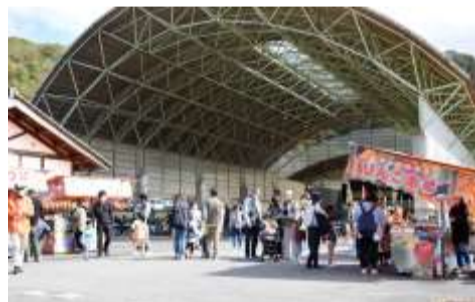
昨年のふるさとまつり

布野ふるさとまつり実行委員会ではイベントを盛り上げる企画を募集します。また委員としてイベントに参画していただくこともできます