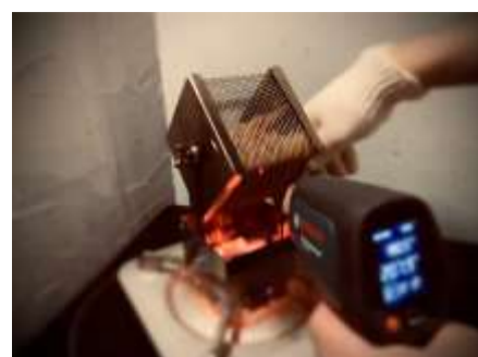
温度を測定しながら焙煎

自宅で簡単にできる器 具を使ったコーヒー豆の 焙煎体験。美味しく淹れ るドリップのコツとあわ せて、プロの講師が直接 指導。