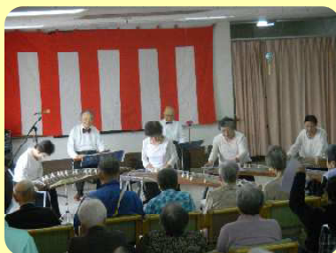
やさしい琴の音色にうっとり 綺麗な音色♪♪♪