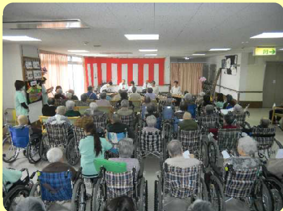
演奏に聞き入る利用者のみなさん みんなで合唱も♪♪♪