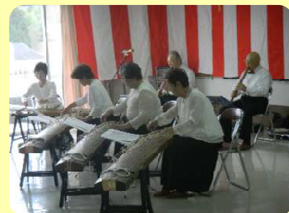
琴と尺八のコラボもみごとに調和です

11月24日、尺八「秦友会」と琴「あかね会」の皆様による邦楽演奏会を開催致しました。尺八と琴のコラボレーションによる演奏で、名曲の数々をご披露いただいた後、全員で童謡もみじ・夕焼けこやけ・旅愁を合唱しました。和の音色が心に響き、皆さんとても喜ばれました。