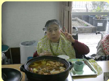
あったかーいだから♪♪